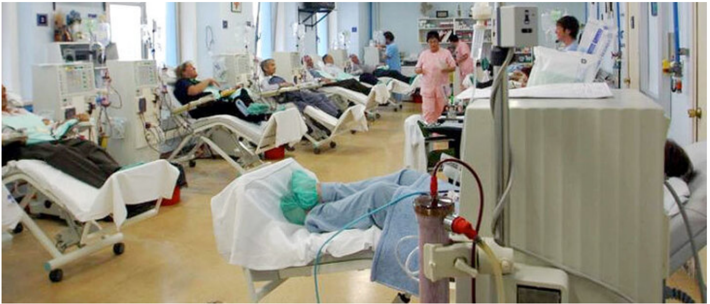
Hemodialisis unitate bat